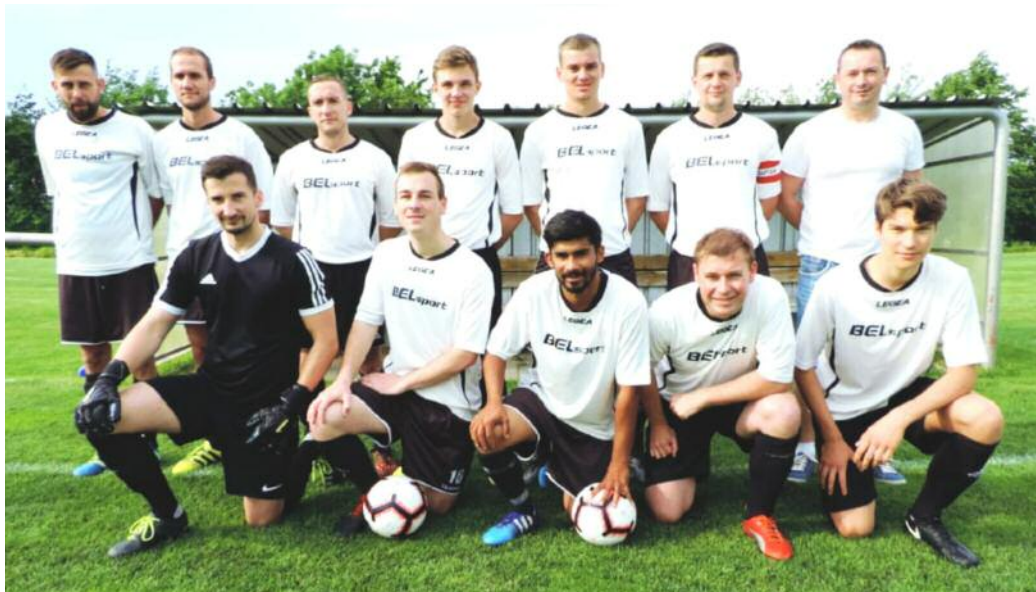
Tým z Nového Hradce Králové covid hatí plány na postup, hráči však i tak věří, že postup napotřetí vyjde.