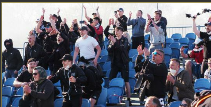
■ Po zápase s Duklou se slavilo i s fanoušky.