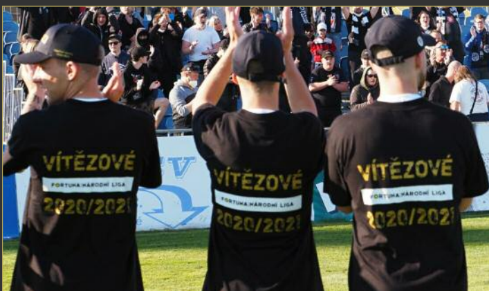
■ Hradec si s předstihem zajistil triumf ve druhé lize.