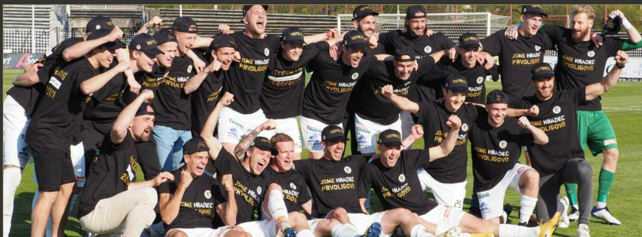
■ FC Hradec se po čtyřech letech vrací do první ligy.