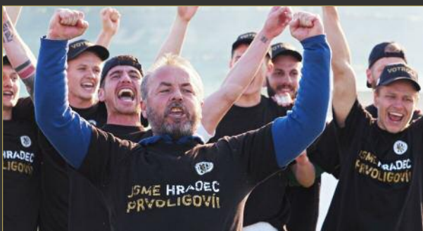
■ Tým dovedl do ligy kouč Zdenko Frtala, který však po sezoně odchází.