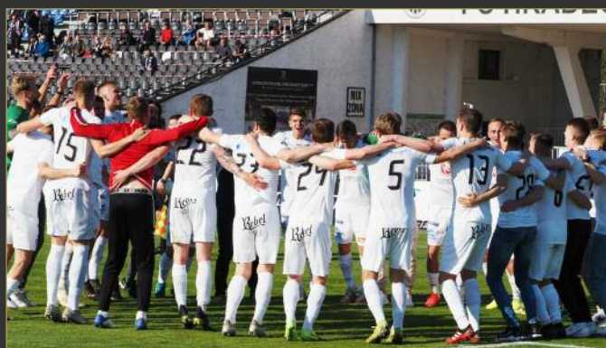
■ V postupovém zápase udolal Hradec pražskou Duklu.