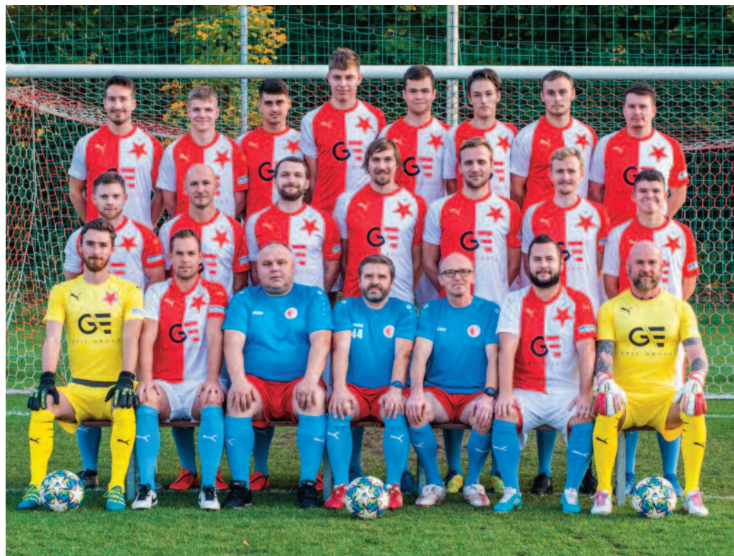
Hradecká Slavia je zatím velkým překvapením Votrok krajského přeboru.