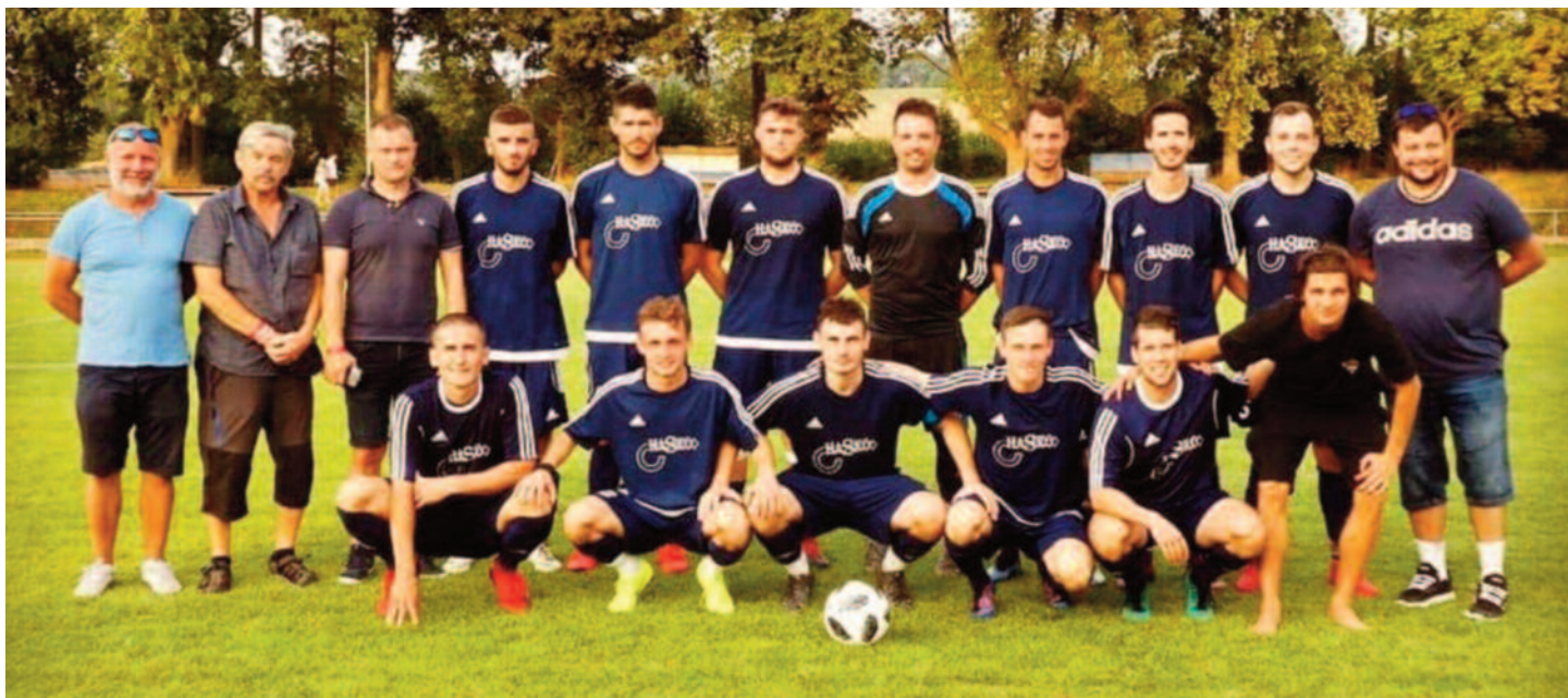
Fotbalistům Sobotky se začátek letošního ročníku nevydařil podle představ.

Podle mě je dobře připravený tým z Jaroměře. Hlavně díky svým dvěma novým hráčům Gorolovi a Kořínkovi. (vek)