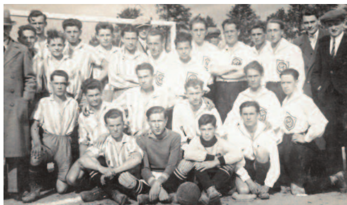
Jedna z prvních fotografií mužstva SK Nový Hradec.

Na počátku dvacátých let minulého století průkopníci novohradeckého fotbalu hrají II. třídu. Do roku 1926, kdy