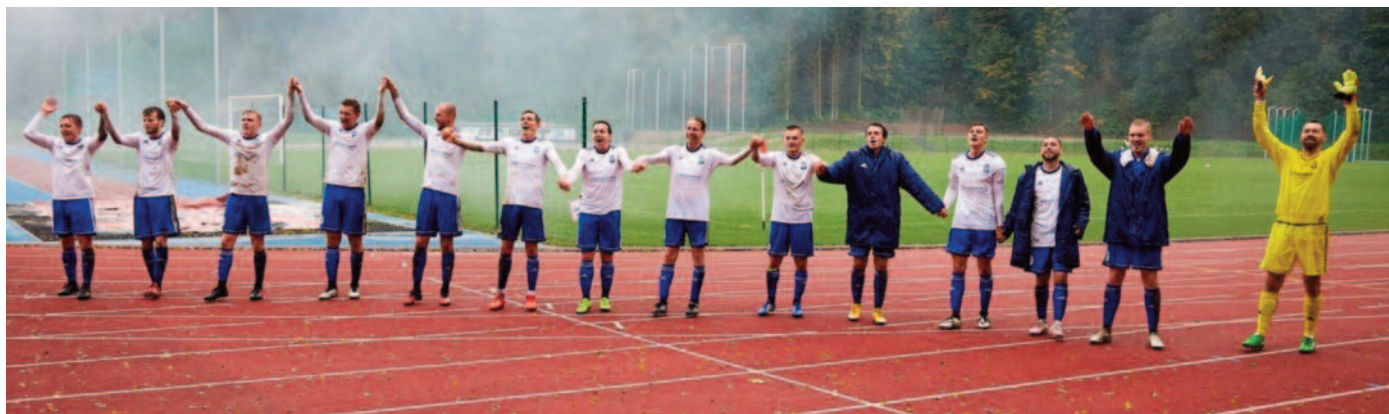
Fotbalisté Trutnova takhle slavili výhru v posledním odehraném utkání nad Nymburkem (3:0).

Já fandím Spartě, takže věřím, že po dlouhé době získá i vytožený titul. (vek)