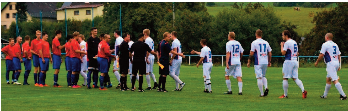
Fotbalistům Hejtmánkovic se začátek sezony vůbec nevyvedl, když prohráli všech osm zápasů.