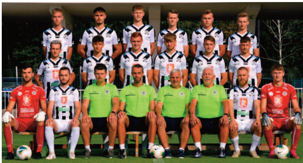
Rezervě Hradce se začátek letošní sezony výsledkově příliš nedařil.