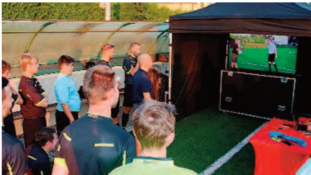
Při seminářích se chyby rozebírají před obrazovkou.