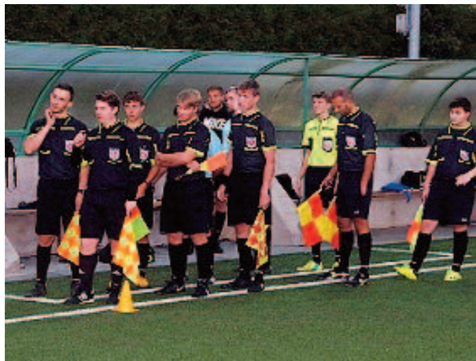
Mladí rozhodčí OFS Rychnov mají semináře třikrát do měsíce.

Pro praktické semináře je kamera a televize užitečná. Na každém praktickém semináři je k dispozici kamera a velkoformátová televize. Rozhodčí jsou během cvičení natáčeni a své výkony mohou obratem vidět na televizi. Vidí špatný pohyb, nepřesnou signalizaci a mohou na jejich zlepšení okamžitě pracovat. „Zpětná vazba během pár