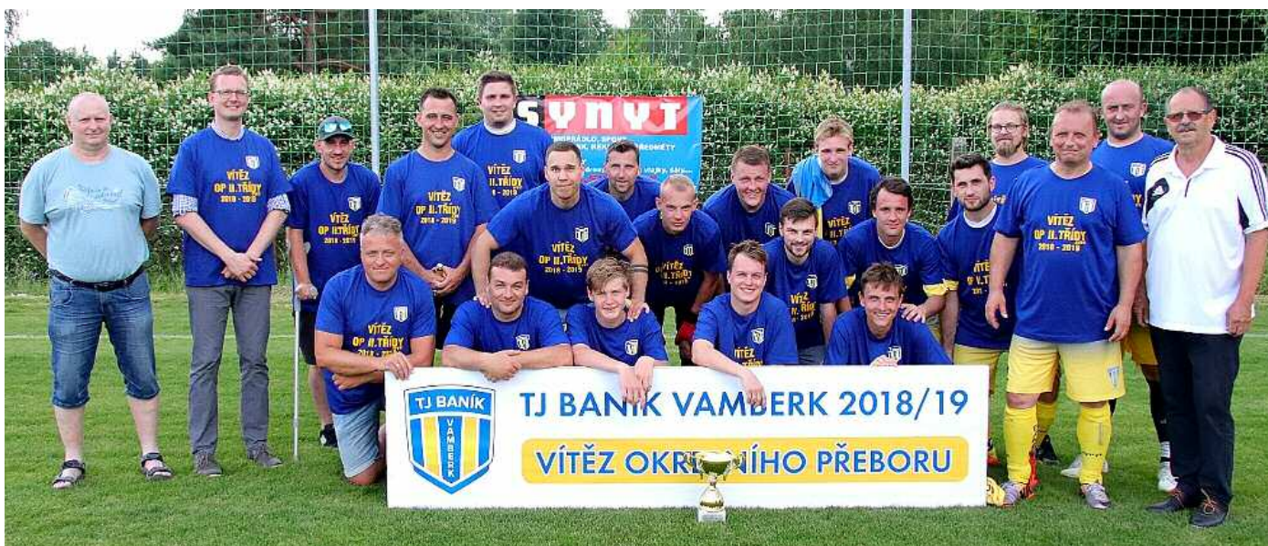
Baník Vamberk slavil po minulém sezoně postup do I. B třídy.

Úspěchy: Mnoho v mládežnických kategoriích, v mužské kategorii postup do krajské 1. B třídy.