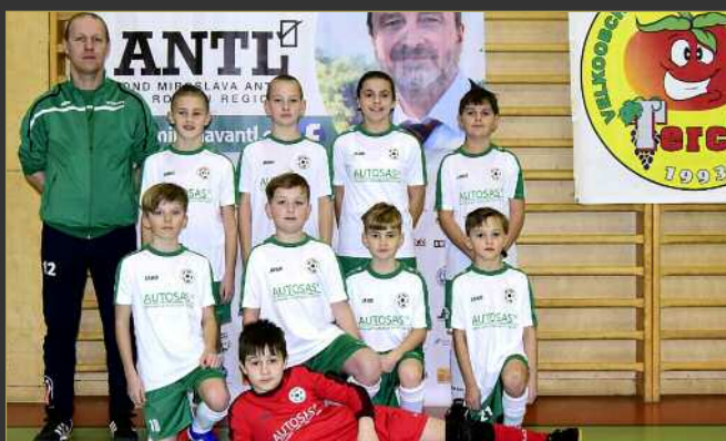
■ SK Solnice