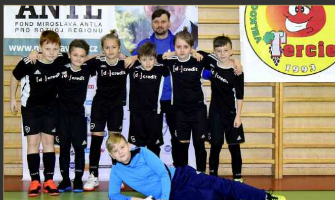
■ SK Dobruška/Spartak Opočno