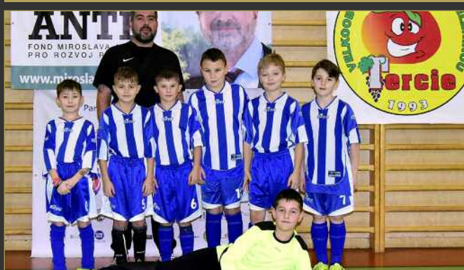
■ FK Kostelec nad Orlicí/AFK Častolovice B