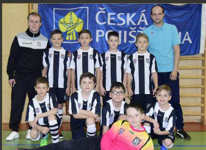
■ Velešov Doudleby nad Orlicí/TJ Sopotnice