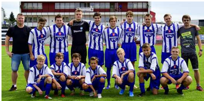
Společenství Kostelec/Častolovice hraje nejvyšší krajskou ligu dorostu.

Trenérské motto: Poctivost a pile v tréninku se dřive nebo později projeví.