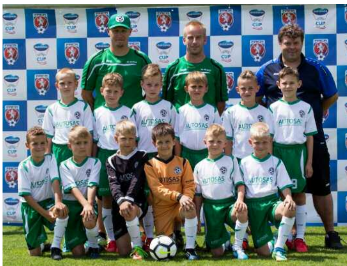
V roce 2018 ukázala Solnice, jak silný má ročník 2009. Na Ondrašovka Cupu skončil na skvělém pátém místě.