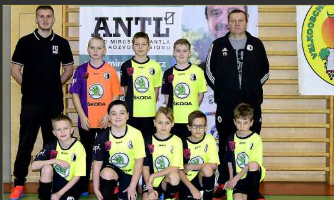
■ Spartak Rychnov nad Kněžnou