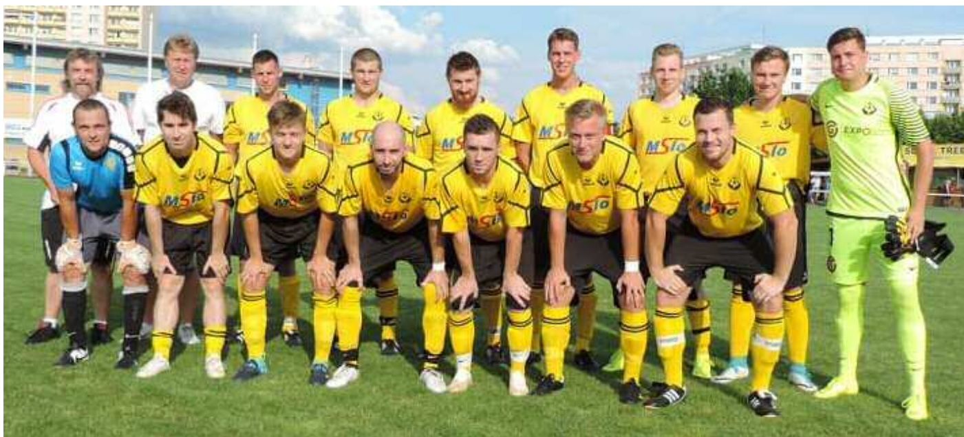
Černilov byl při přerušení soutěže na jedenáctém místě přeboru.

Úspěchy: Vítězství v krajském přeboru dorostu s TJ Sokol Třebeš, postup do krajského přeboru mužů s FK Černilov.