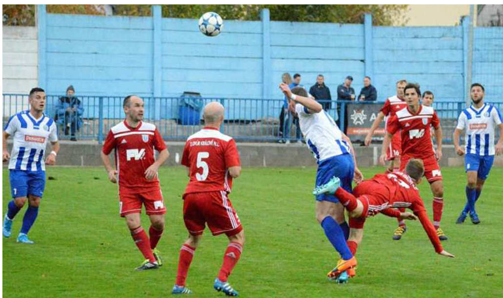
Ozdobou divize je i východočeské derby Náchod vs. Dvůr Králové.

Určitě jsme s panem Teodoridisem ve spojení, navzájem si pomáháme, ale každý zvláště pečujeme o náš sport, já o fotbal, on o hokej. Oba dva se snažíme touto cestou pomáhat mládeži a sportu ve městě. (pvh)