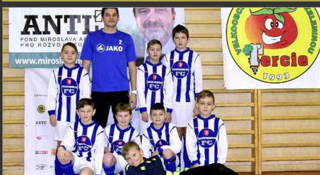
■ FK Kostelec nad Orlicí/AFK Častolovice A