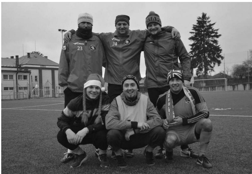
Fotbalový klan Mondíků. Potkají se někdy spolu na hřišti?