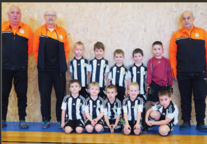
■ Fotbalová školička FC Hradec Králové - černobílí