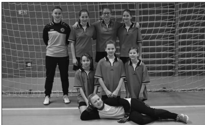
OFS Náchod - U13