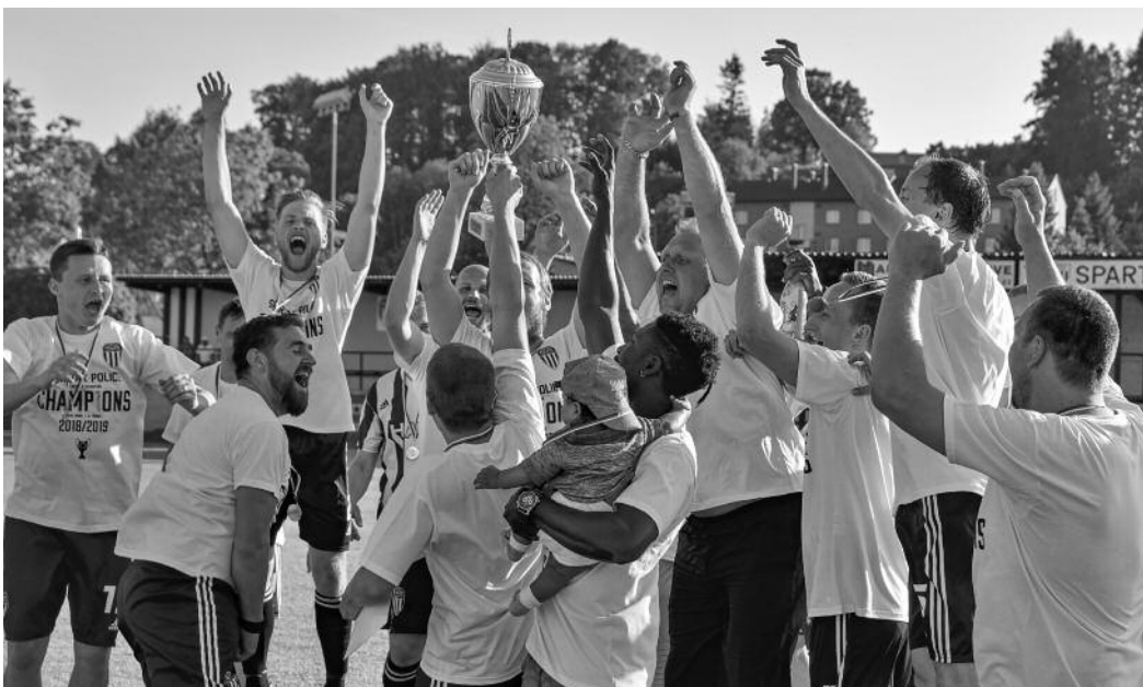
Police slavila minulé jaro titul v A třídě a postup do krajského přeboru.