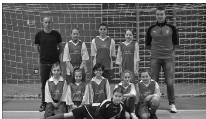
OFS Rychnov nad Kněžnou - U11