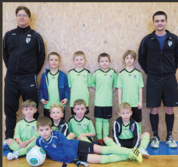
■ FK Vysoká nad Labem - zelení