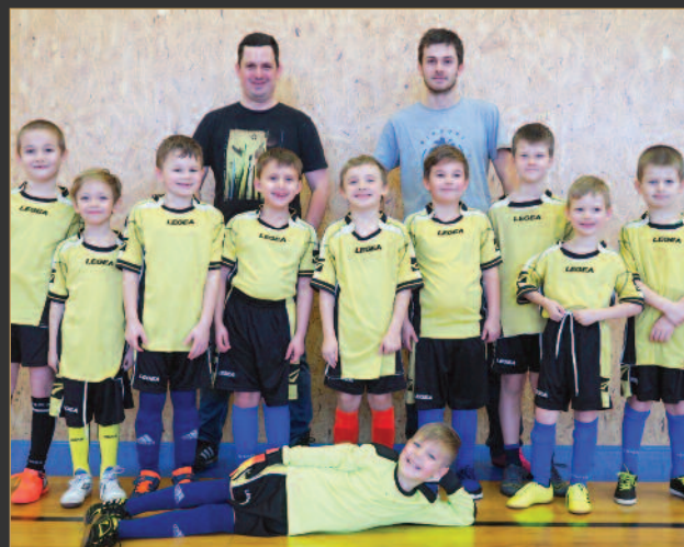
■ FK Chlumec nad Cidlinou