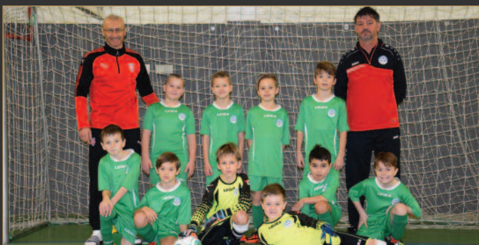
■ OFS Trutnov