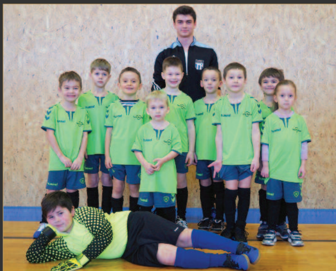
■ Sokol Hoříněves