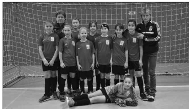
OFS Trutnov - U11