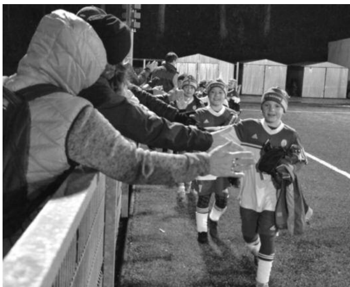
Náchodský tým U10 slaví s rodiči.