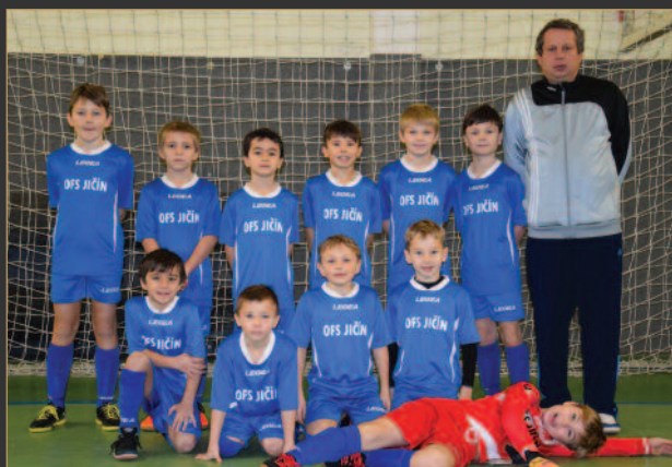
■ OFS Jicín