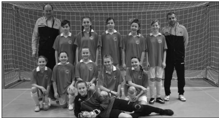
OFS Hradec Králové - U13