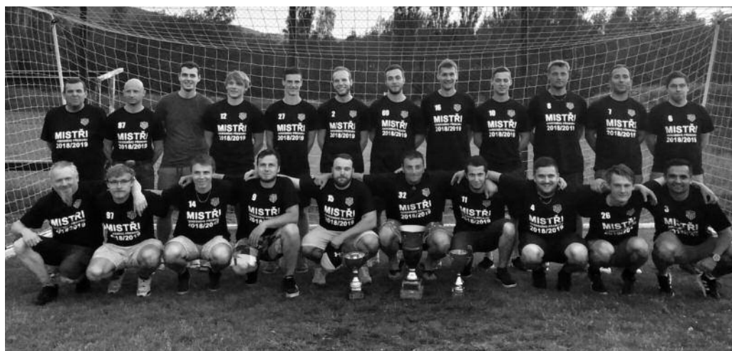
Tým Žacléře, nováček I. B třídy.