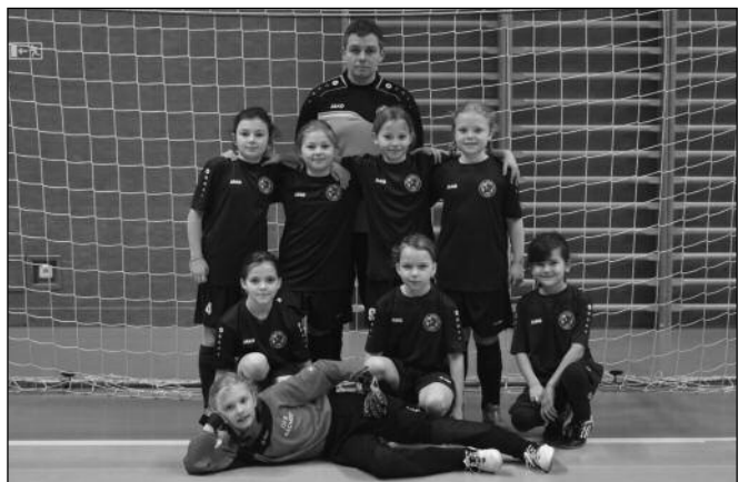
OFS Náchod - U11