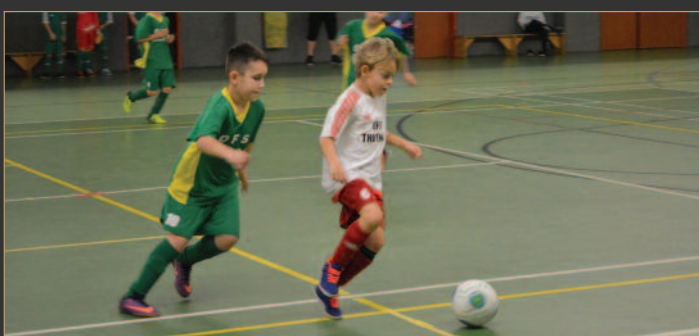
■ OFS Náchod