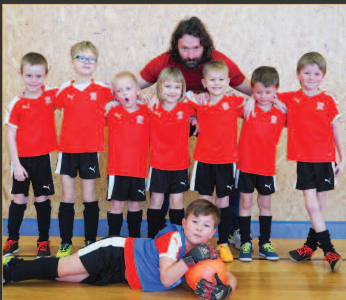
■ Sokol Lhota pod Libčany