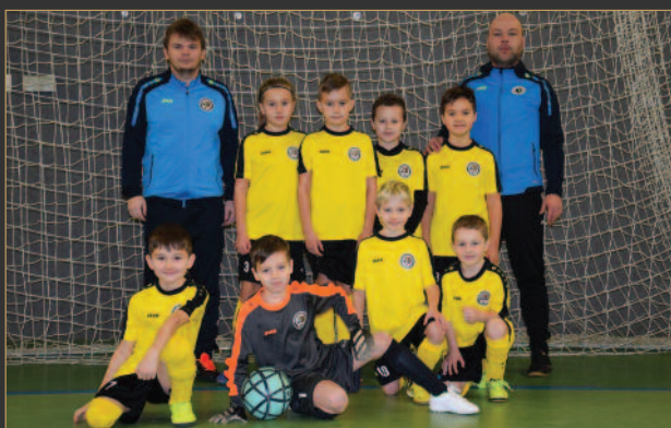
■ OFS Hradec Králové