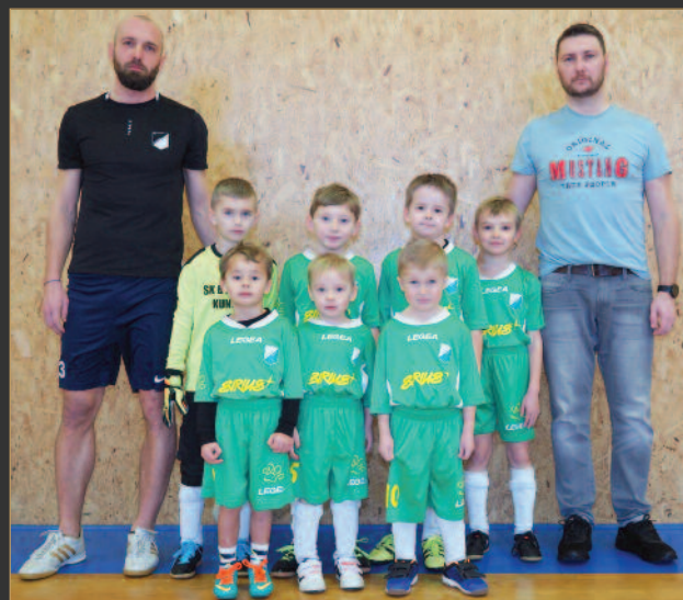
■ Bystřian Kunčice