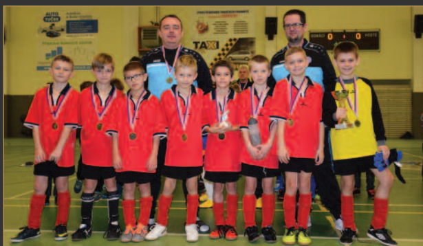
■ OFS Náchod