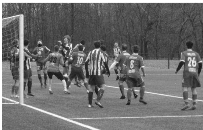
V přeboru se odehrálo jen první jarní kolo - takže i zápas Jičín vs. Cidlina.