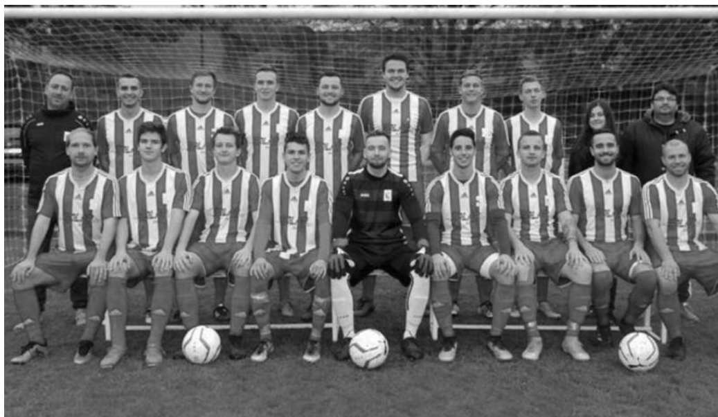
Jaroměř hraje v A třídě o záchranu.