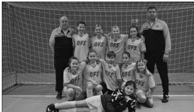
OFS Hradec Králové - U11