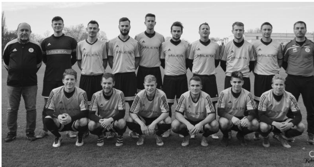
Jiskra Hořice se musí obávat o záchranu v krajském přeboru.

Oblíbený klub/hráč: Real Madrid /Cristiano Ronaldo.