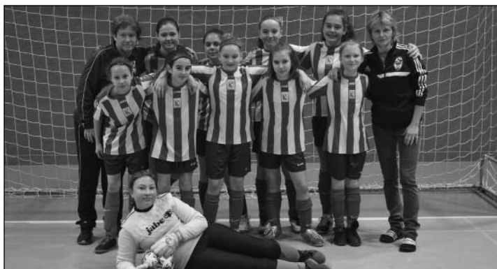
OFS Trutnov - U13