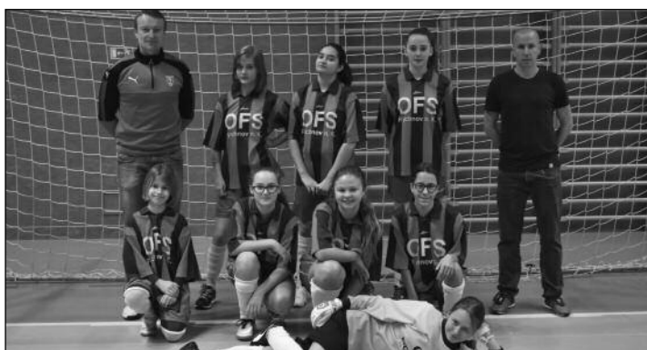
OFS Rychnov nad Kněžnou - U13