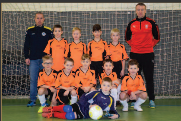
■ OFS Rychnov nad Kněžnou