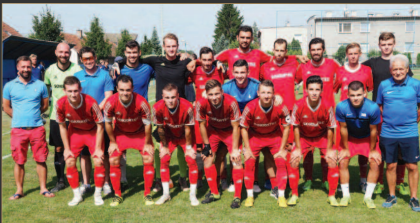
■ FK Chlumec nad Cidlinou, první tým, který hraje Českou fotbalovou ligu.