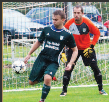
■ V Hradecký Votrok okresním přeboru vyhrála Červeněves v Ohnišťanech 4:2.