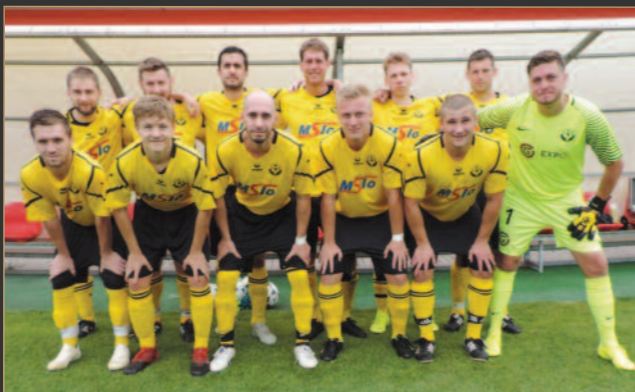
■ FK Černilov, nováček krajského přeboru.