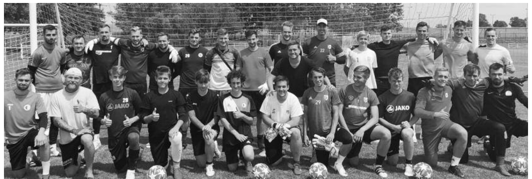
Gólmanského turnaje v Černilově se zúčastnilo dvacet devět brankářů.