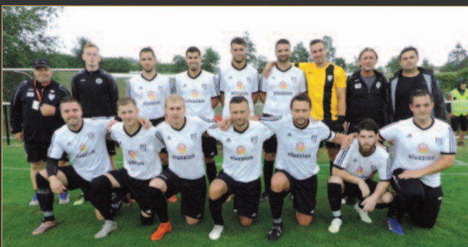
■ FK Vysoká nad Labem, tradiční účastník Votrok krajského přeboru.