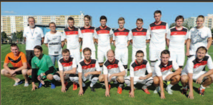
■ Sokol Třebeš má letos v krajském přeboru nemalé ambice.