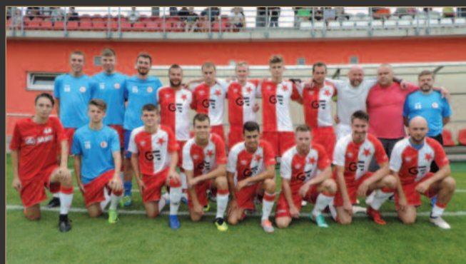
■ FC Slavia Hradec Králové hraje krajský přebor.