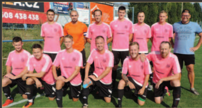
■ Lokomotiva Hradec Králové hraje i v této sezoně AM Gnoi I. A třídu.